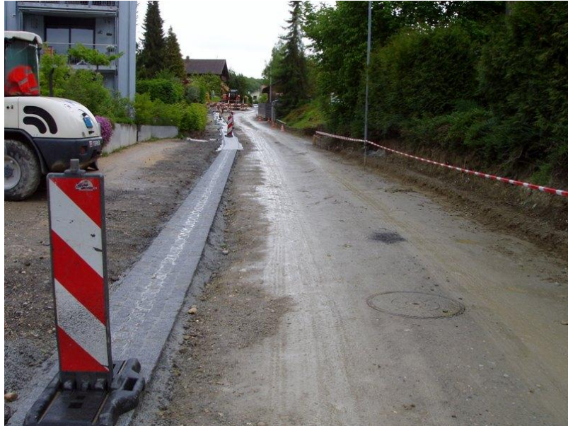
Beginn der Pflasterarbeiten am Mattenweg (Mai 2013)