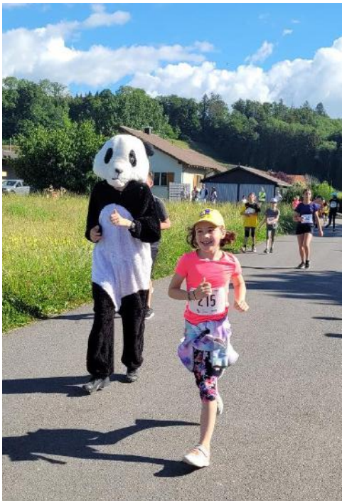
Der Panda läuft mit.

Im Mai führte die gesamte Schule in Gampelen einen Sporttag durch. Nebst Gemeinschaftsspielen nahmen die Kinder an einem Sponsorenlauf des WWF teil. Wir konnten im Juni dieser Organisation den hohen Betrag von Fr. 24'835.- überweisen. Diese Sponsorengelder werden dafür eingesetzt, den Regenwald und die darin lebenden Tiere zu schützen. Allen Spendern danke ich im Namen der Schule ganz herzlich für die grosszügige und nicht selbstverständliche Unterstützung.