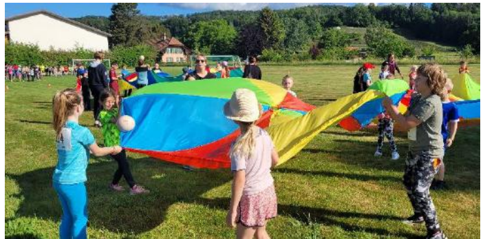
Konzentration, Freude und Bewegung