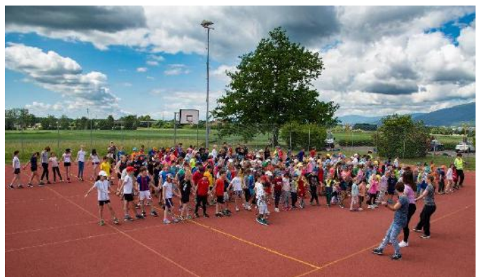
Zum Schluss ein gemeinsamer Tanz mit 270 Kindern.