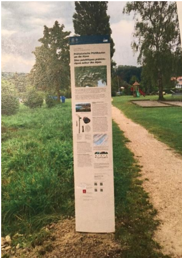
Muster einer Informationstafel

Während eines Spaziergangs auf der Hasenburg ist vielleicht schon die Frage aufgetaucht, welche geschichtlichen und archäologischen Hintergründe der 1'000 Jahre alten Erdwallbefestigung zugrunde liegen könnten und welche Erkenntnisse nach den umfangreichen Geländeuntersuchungen heute als gesichert betrachtet werden dürfen.