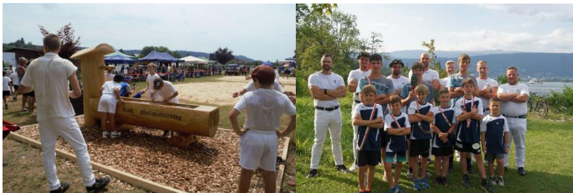
Der Brunnen diente nicht nur der Abkühlung, sondern auch als Gabe