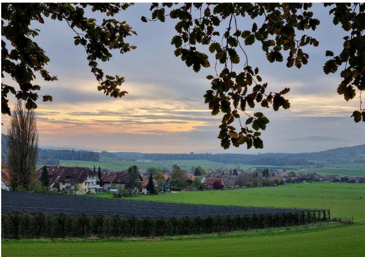
Herbststimmung in Vinelz