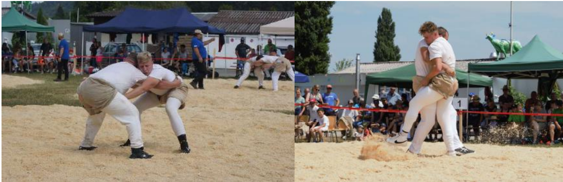
Unsere Nationalturner geben Vollgas beim Schwingen