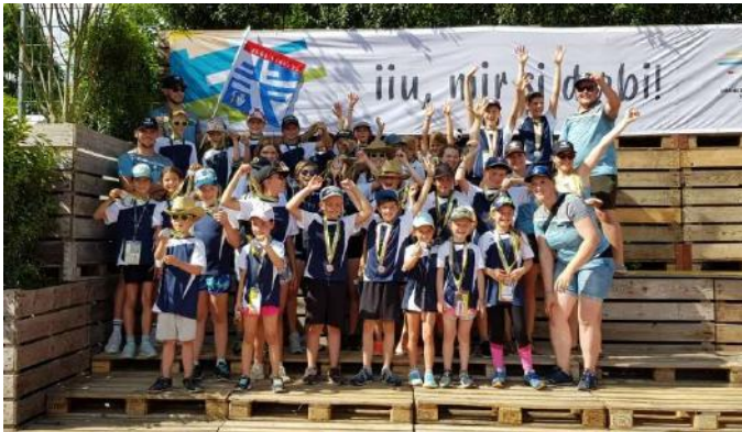
2. Platz der Jugi am Bern. Kant. Jugitag Lyss – Aarberg 2022