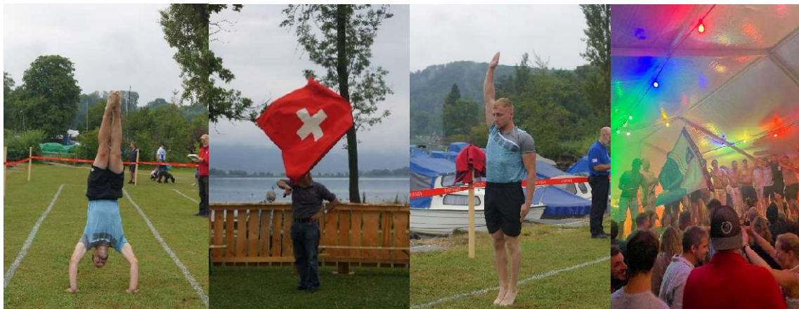
Zu der Vornote gehört auch die Freiübung dazu