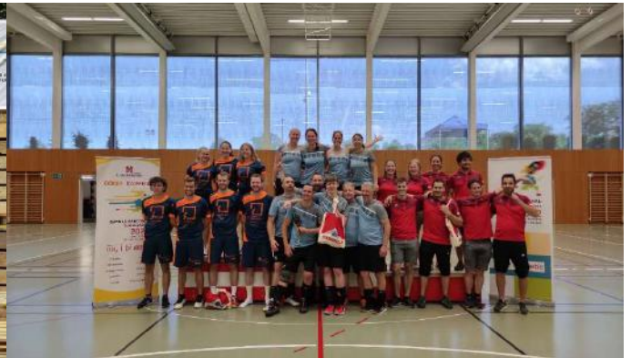
1. Platz unserer Volleyballspieler:innen Kat. Mixed am Bern. Kant. Turnfest Lyss-Aarberg 2022