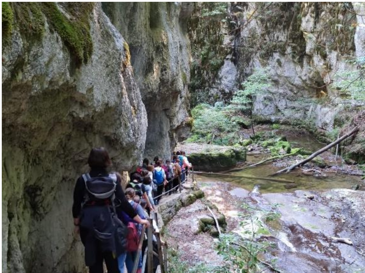
Gemeinsam unterwegs